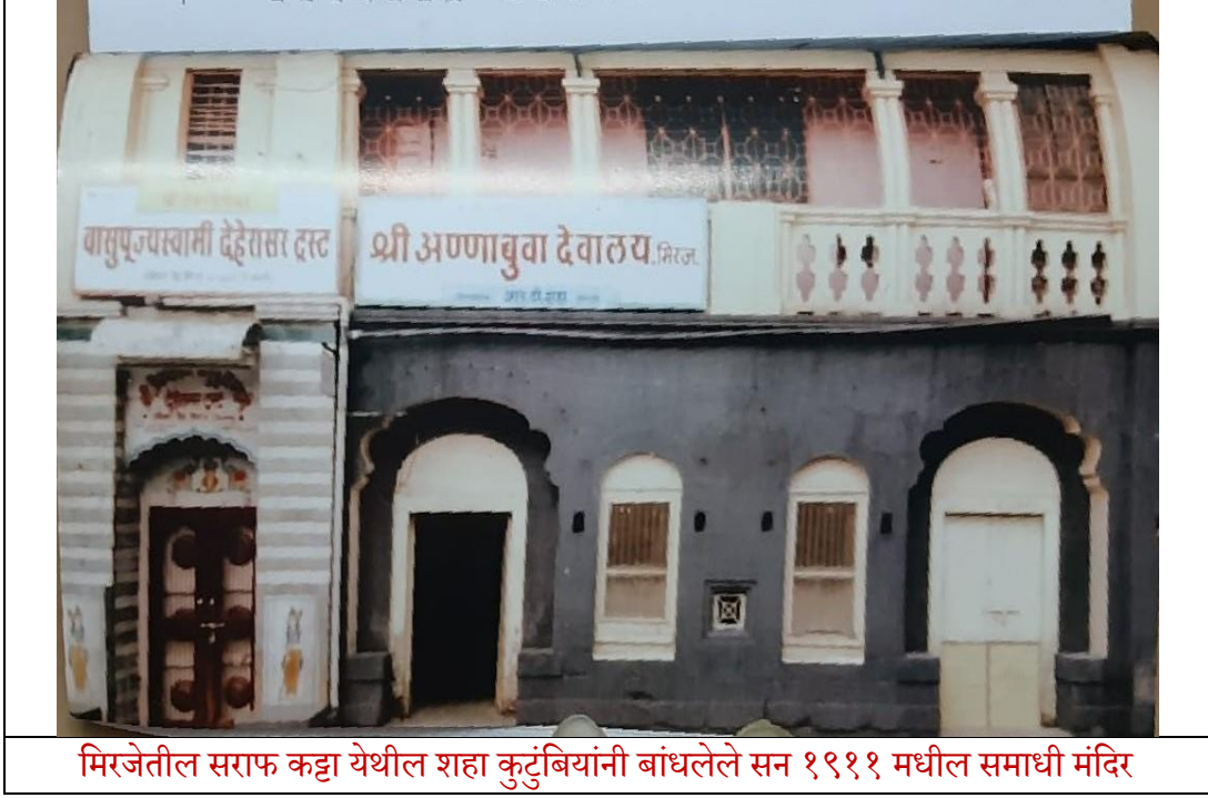
मिरजेतील सराफ कट्टा येथील शहा कुटुंबियांनी बांधलेले सन १९११ मधील समाधी मंदिर